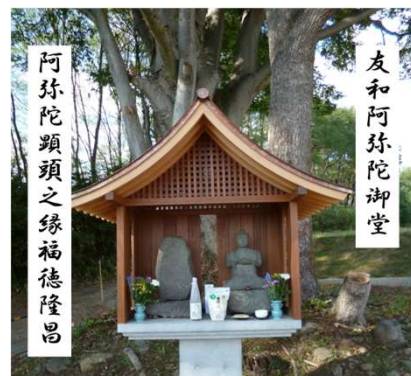
▲完成した阿弥陀如来堂 以前の木の頭部も一緒に祀っています。

9月17日(水) 友和の森 阿弥陀堂を建立し、完成式をとり行いました。式にはユウワの役員・社員が参列し、完成を祝いました。