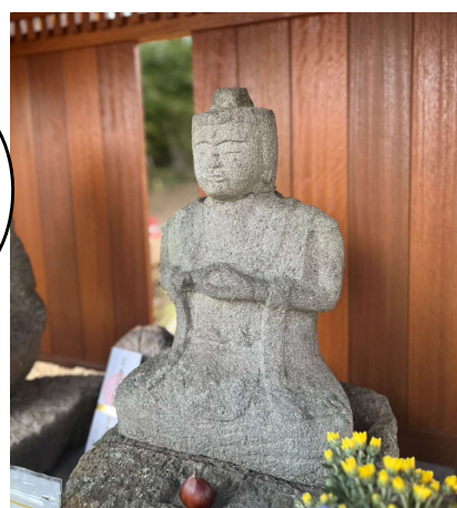
▲穏やかな表情です。よくみると、首にツなぎ目がみえます。