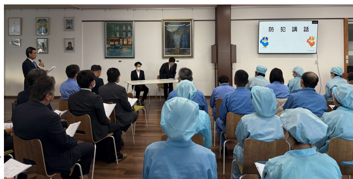
▲参加企業、ユウワ社員合わせて100名程が講話を聞きました。